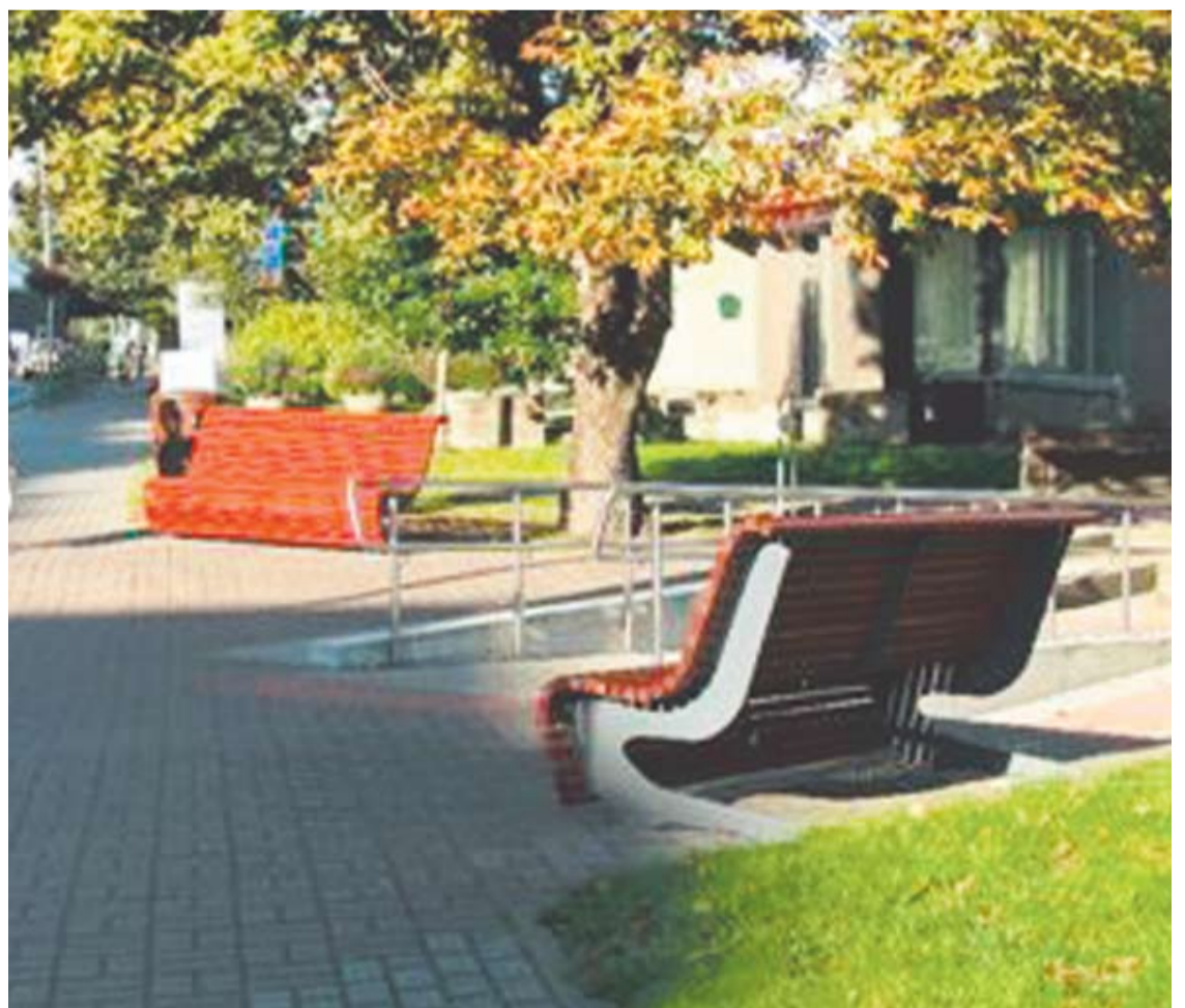
Naujieji suoliukai pritaikyti patogiai atsisėsti ir neįgaliesiems.