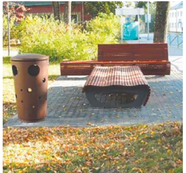
Vaizdas su naujaisiais suoliukais ir šiukšliadėže.

Kiekviena miesto detalė turi būti apgalvota, estetiška, patvari, kelianti miesto prestižą, transliuojanti gerą žinią apie miestą. Taip galvoja daugelis, tačiau būna ir nepatenkintų. Anykštietiška „Nykščių“ portale, beje, ir laikraštyje „Šilėlis“, atsirado ne vienas straipsnelis apie Anykščių J. Biliūno gatvėje statomus suoliukus ir miesto šiukšliadėžes, neva „šių pirkinų kaina, švelniai sakant, vienus stebina, o kitus – šokiruoja“.