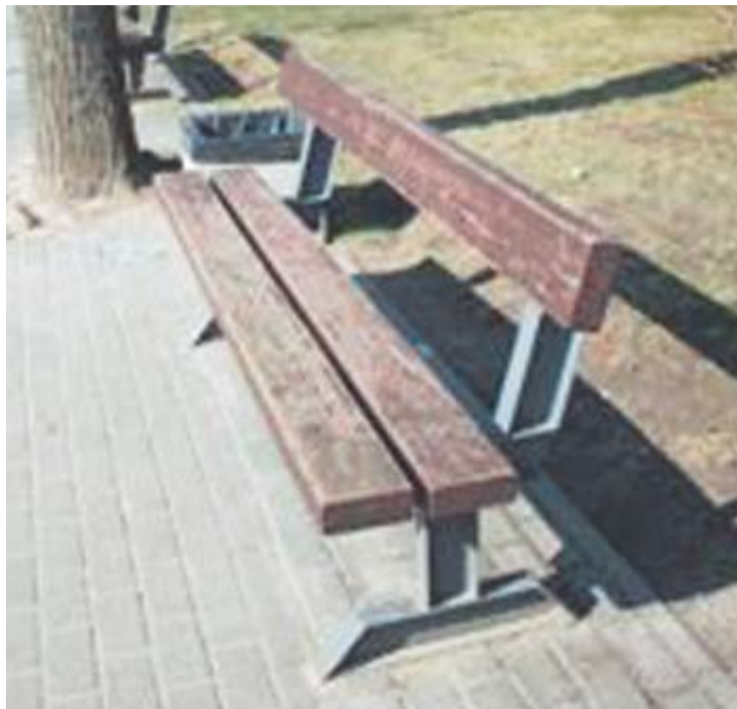
Senasis Anykščių miesto suoliukų vaizdas.