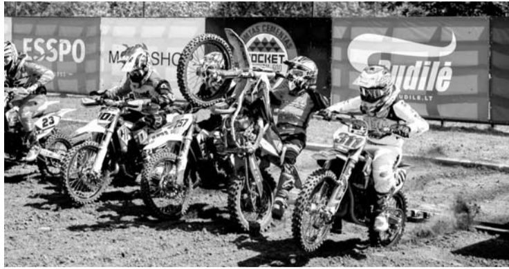
Vieno iš Lietuvos motokroso čempionato etapų varžybos Mickūnuose tradiciškai pritraukia žiūrovų minias.

Bilietų kainos išlieka tokios pat, kaip buvo ir pernai - šeštadienio bilietas kainuos 10 eurų, sekmadienio -15. Dviejų dienų bilieto kaina - 20 eurų. Vaikai iki 12 metų į renginį bus įleidžiami nemokamai, neįgaliesiems taikoma 50 proc.