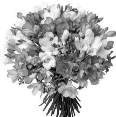
sveikina vyras ir vaikai su šeimomis